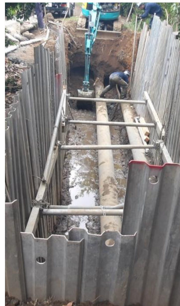
令和7年7月地域導管工事